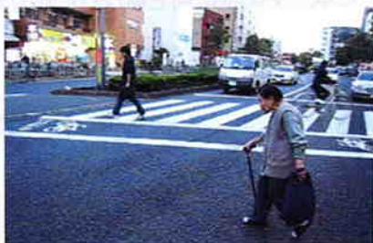
まつさんの通勤風景

東京都道311号環状八号線は、東京都大田区羽田空港から世田谷区、杉並区、練馬区、板橋区を経由して東京都北区に至る環状の都道(主要地方道)。