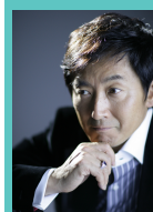
石田純一 氏 (俳優)